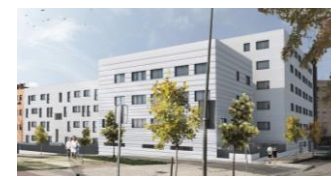
VIVIENDA TIPO 2D-V2