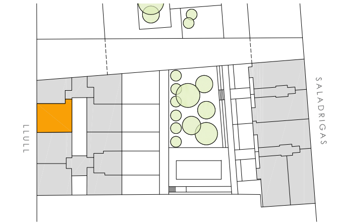
PLANTA PRIMERA - SEGUNDA - TERCERA - CUARTA