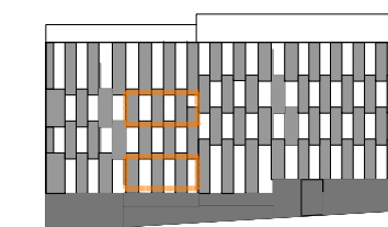
PLANTA PRIMERA/ TERCERA