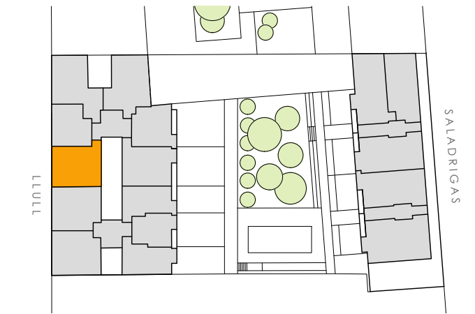
PLANTA PRIMERA - SEGUNDA - TERCERA - CUARTA