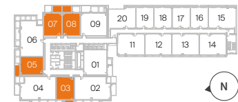
Plantas 02 a 09