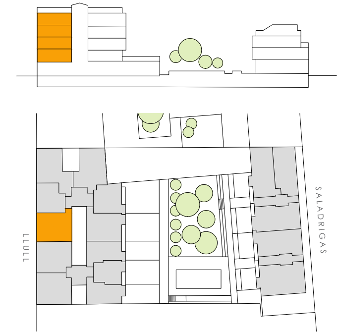
PLANTA PRIMERA - SEGUNDA - TERCERA - CUARTA